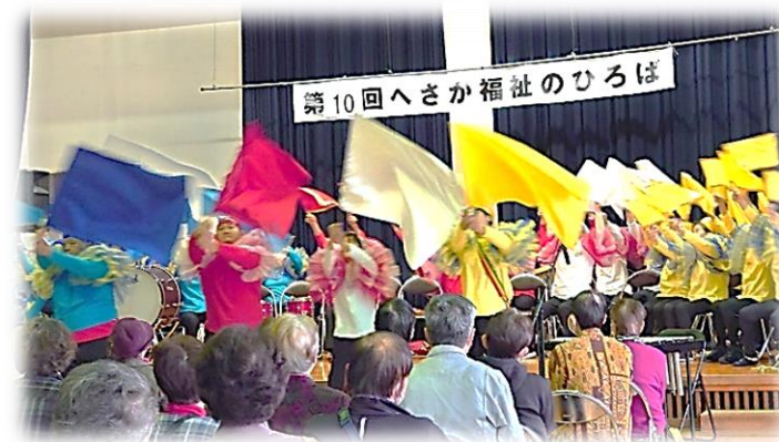
“あんしん大上ドリームチーム”鼓笛隊の活気ある演奏!