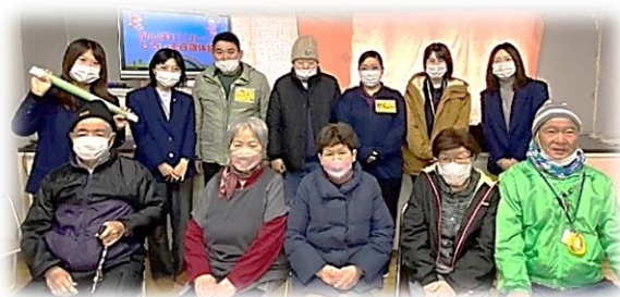
若いメンバーが増え、体操に 活気が増えました!

開催日：毎週金曜日 10:00～11:00 場所：桜上2号館集会所（戸坂桜上町3-2） 参加費：200円/月