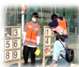
比治山大学 学生ボランティア も大活躍!

東区障害者基幹相談支援センター、東区社協、東区地域支えあい課、戸坂地域包括支援センターは、『戸坂ともいきネット』や各機関の広報、元気じゃ検診の啓発を行い、交響きつつき作業所のお菓子販売など子育て世代の方々ともつながる、賑やかな多世代交流となりました。（記：S.S）