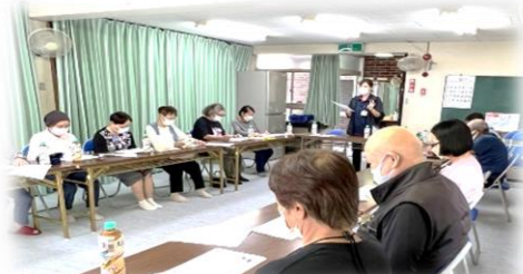
一段と町内が活気に溢れています!

R4年7月、10月、東浄25号館集会所にて、東浄第一自治会主催で、包括支援センターの紹介健康意識を高めるための健康教室を開催しました。